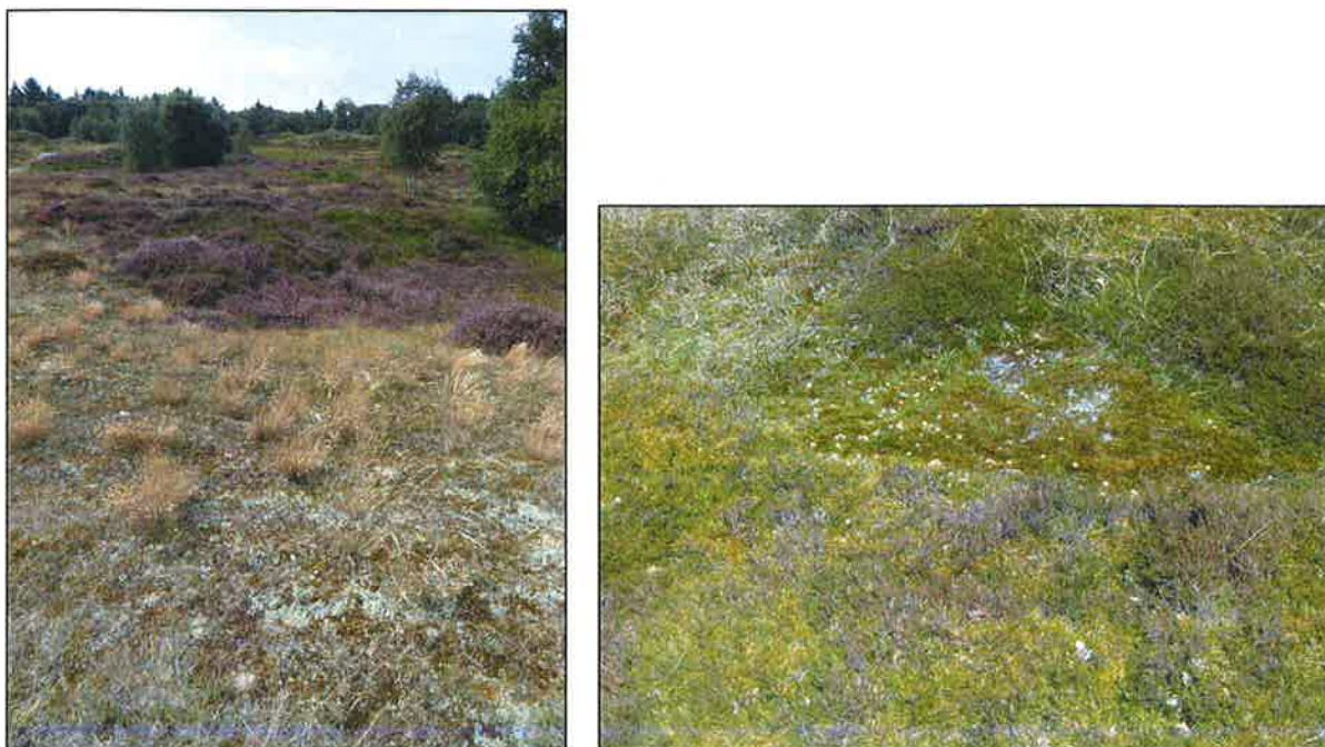
Abb. links: Graudünenlandschaft auf Borkum mit Silbergras, Rentierflechte und Heidekraut in günstigem Erhaltungszustand. Abb. rechts: Stark degradierte Graudüne auf Borkum, mit Moos überwuchert.

Die hohen atmosphärischen Stickstoffeinträge führen zu einer beträchtlichen Degradierung des prioritären Lebensraumtyps 2130* der FFH-Richtlinie. Hier dürfen nur dann Beeinträchtigungen erfolgen, wenn sie unter zwingende Gründe des öffentlichen Interesses fallen wie z. B. Landesverteidigung oder Küstenschutz. Weitere atmosphärische Stickstoffeinträge, die nicht den zwingenden Gründen des öffentlichen Interesses zuzuordnen sind, sind zu vermeiden.