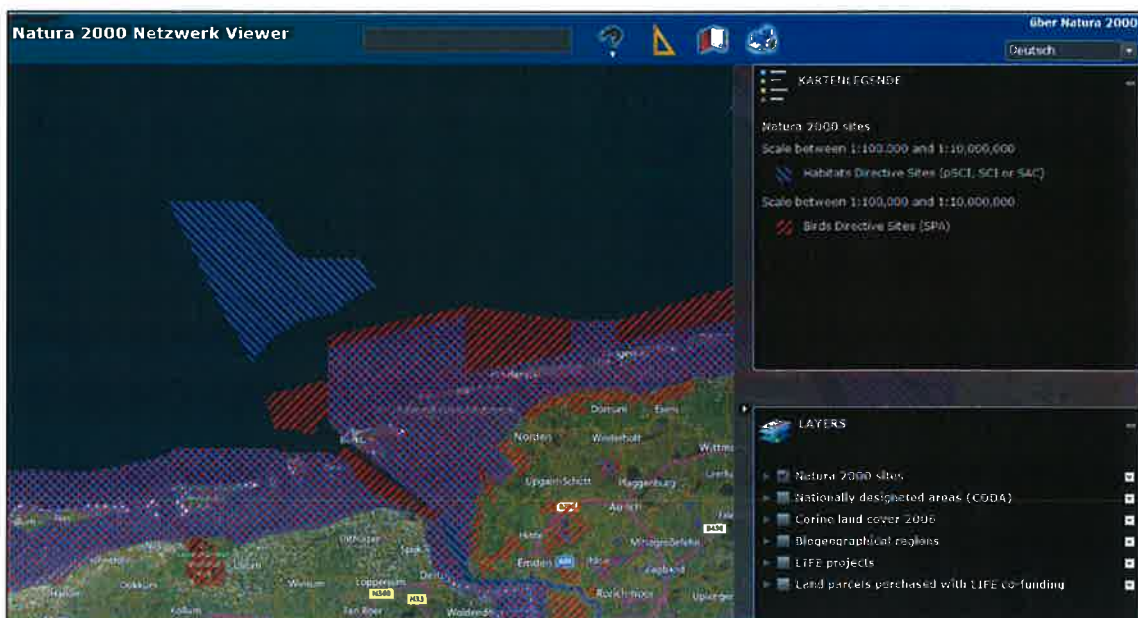
Abb.: Natura 2000-Gebiete, die durch den Flugbetrieb von Eemshaven aus betroffen sind ( http://natura2000.eea.europa.eu ).

Es werden durch den Flugbetrieb Natura 2000-Gebiete beeinträchtigt (siehe Abb.), so dass europäisches Umweltrecht in Form der Flora-Fauna-Habitat-Richtlinie und der Vogelschutzrichtlinie berücksichtigt werden muss.